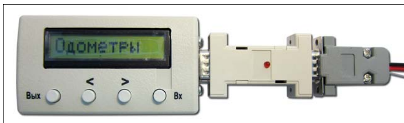
Рисунок 3. Подключение адаптера с насадкой к программатору

5.1 Присоедините к программатору адаптер с насадкой BDM или №1, как показано на рисунке 3.