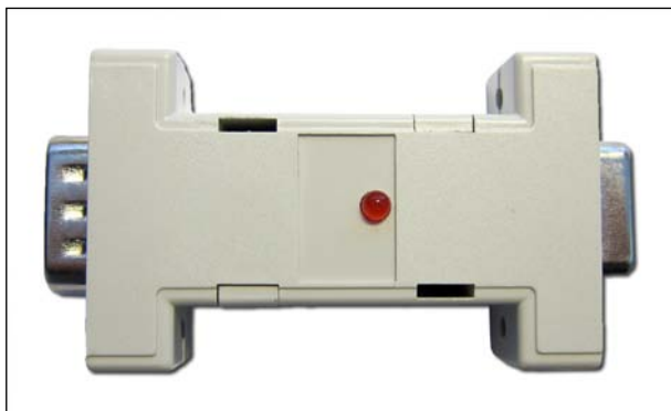
Рисунок 1. Адаптер BDM-ПО5. Общий вид

4.3 Внешний вид адаптера и насадки представлены на рисунках 1 и 2.